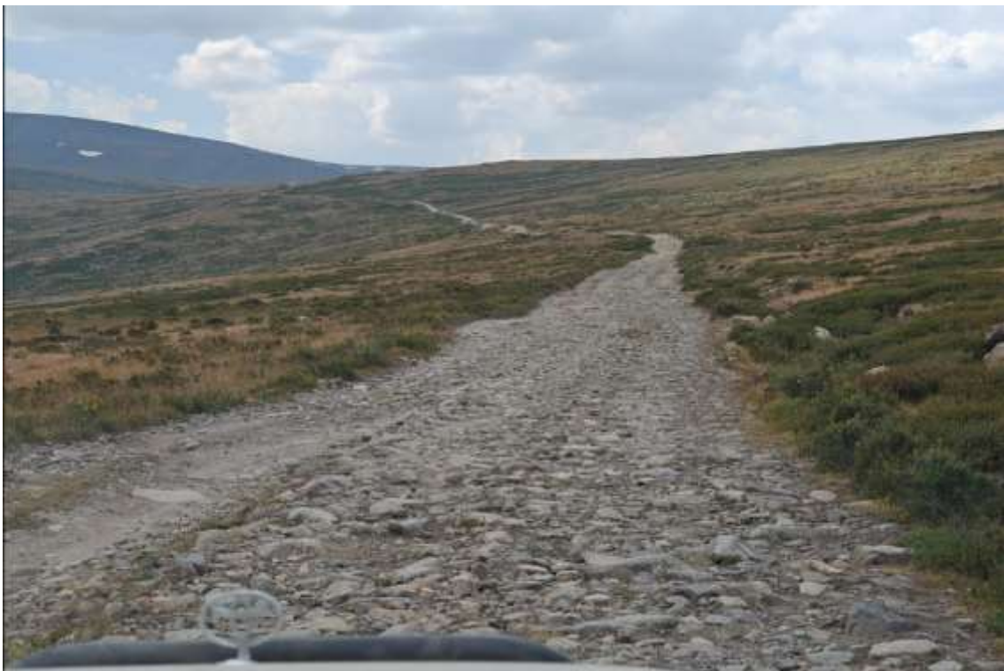
Участки с выходом камней. Крупных и острых камней нет. На нашем автомобиле мы спокойно едем прямо по камням. Для менее подготовленных к бездорожью автомобилей есть возможность объехать слева.