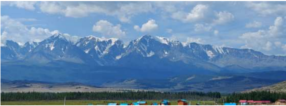
Вид на горы.