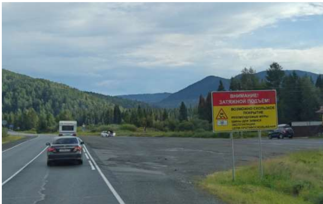
Предупреждающий информационный щит перед началом подъема на перевал.

Асфальтовая дорога, затяжные подъем и спуск с уклоном до 12°.