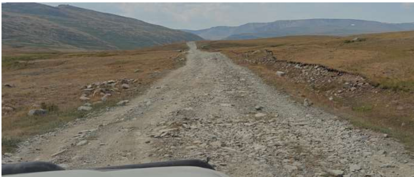
Еще один накатанный объезд участка с камнями.