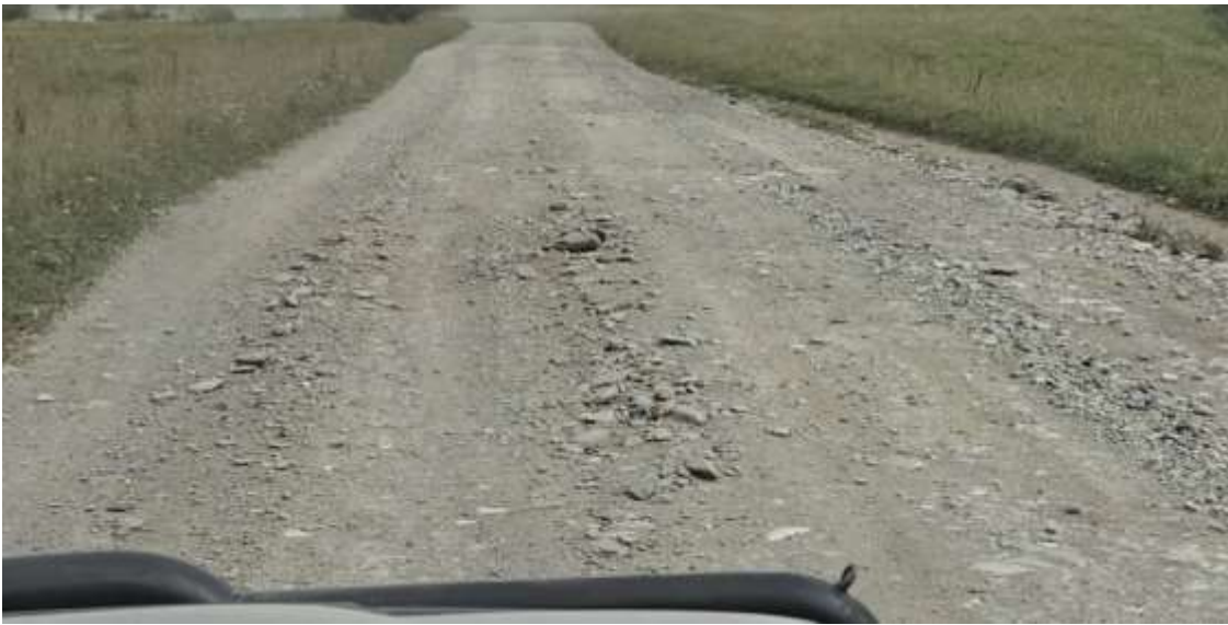
Довольно крупные камни на дороге.