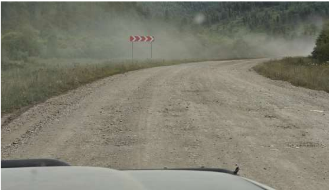
Неровная дорога в крутых поворотах.