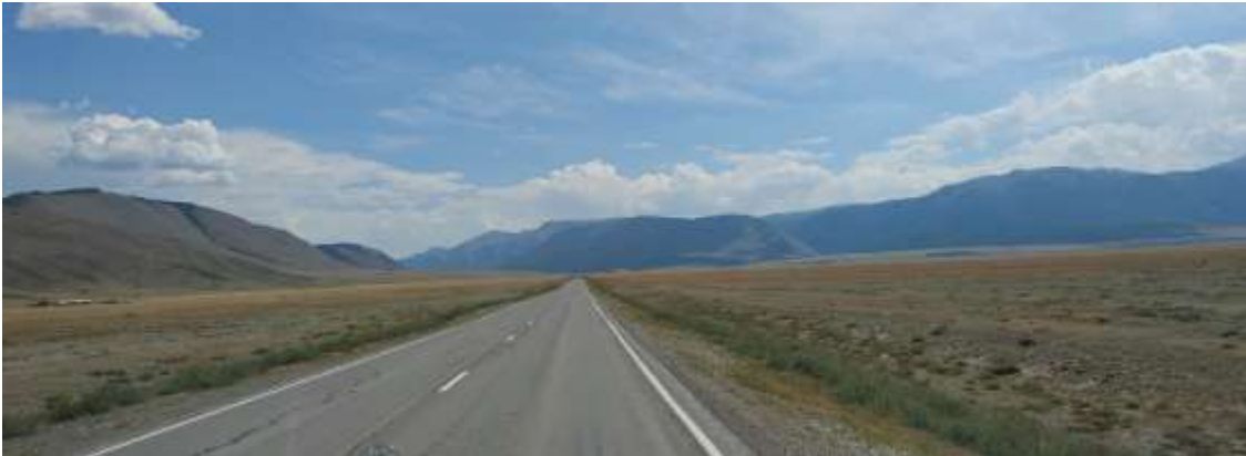
Дорога убегает в даль...

За Кош-Агачем свернули с Чуйского тракта в сторону с. Беяши. Довольно быстро прошли погранзаставу.