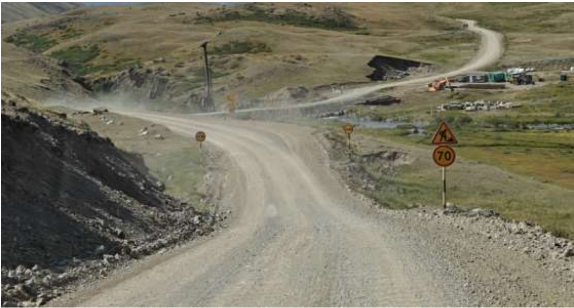
Ведется ремонт моста через реку Тарахта, работает спецтехника, едем через объезд.