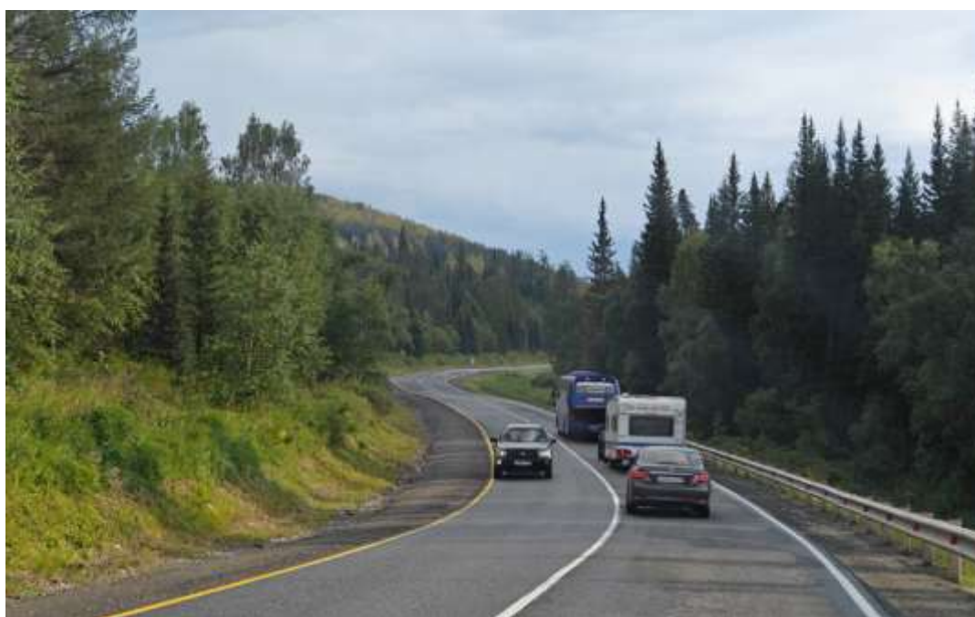
Подъем на перевал. Едем, соблюдая скоростной режим и правила дорожного движения. Подъем и спуск с уклоном до 12%. Затяжной подъем на перевал (9 км) и спуск (11 км.). На подъеме следим за температурой двигателя и коробки передач, чтобы не перегреть.