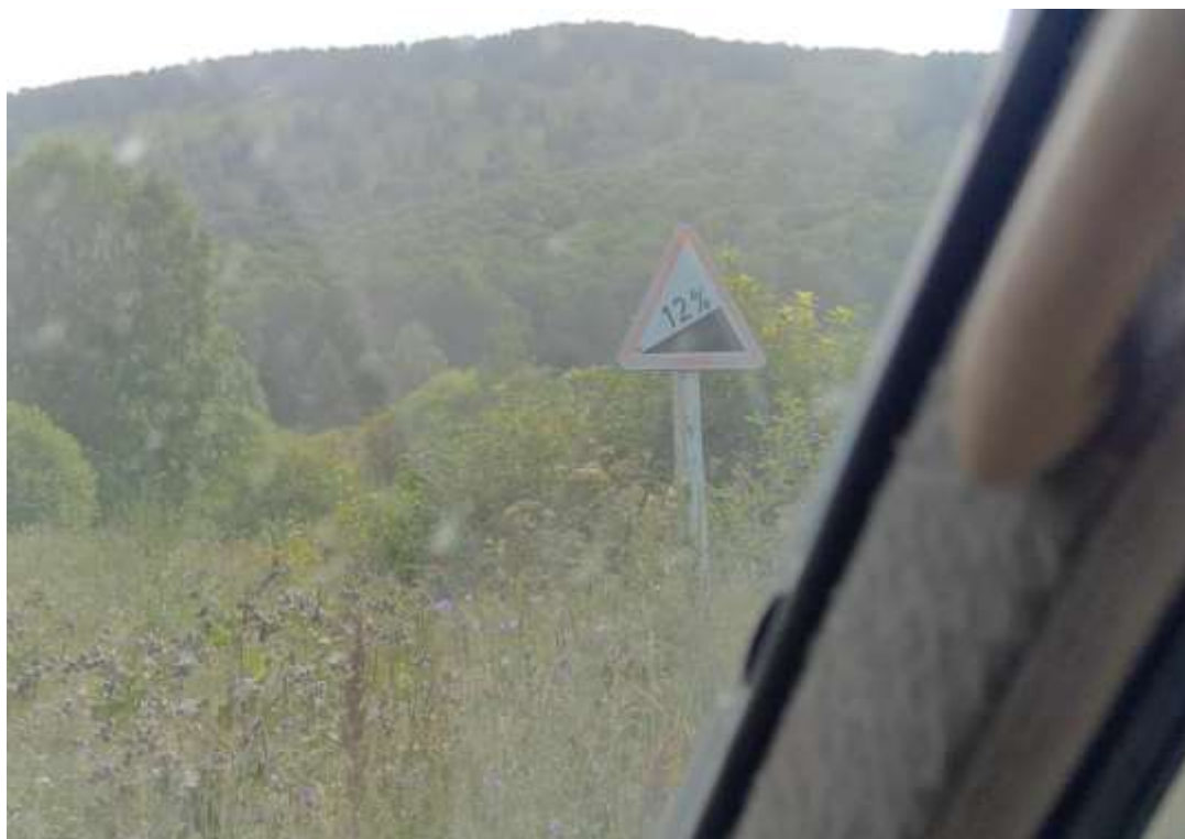
Крутой подъем (уклон до 12%).