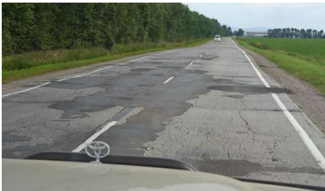
Наплывы, трещины на дороге.

Старый асфальт с выбоинами, трещинами, наплывами, местами волнистый, с ямами с острыми краями.