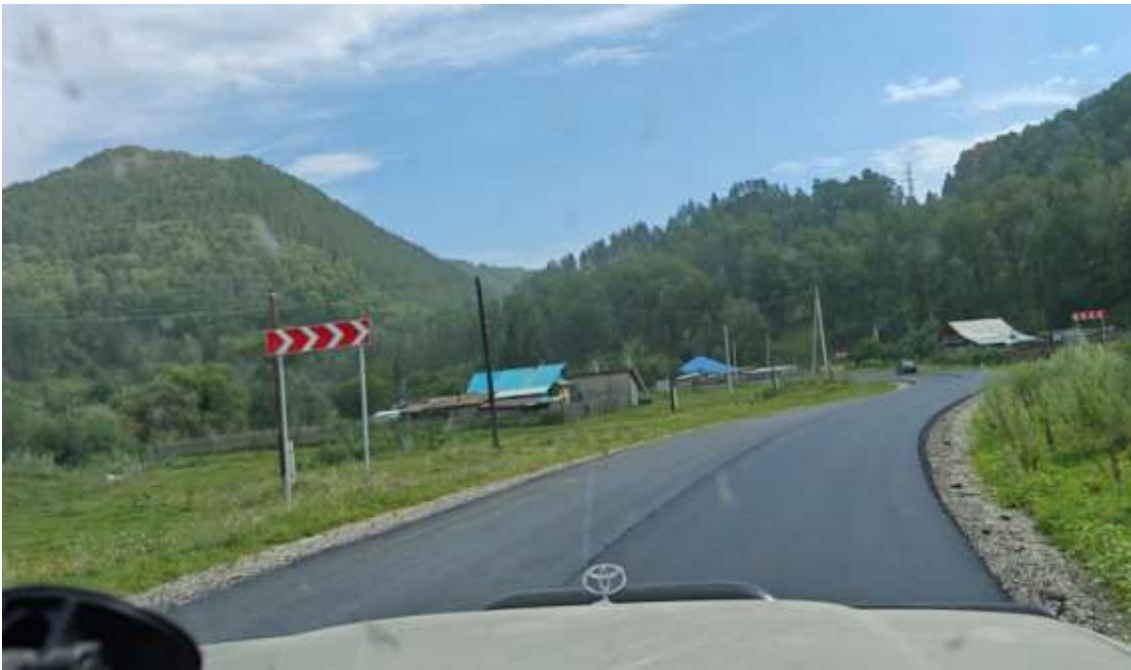
В населенных пунктах положен свежий асфальт. Разметка не нанесена.