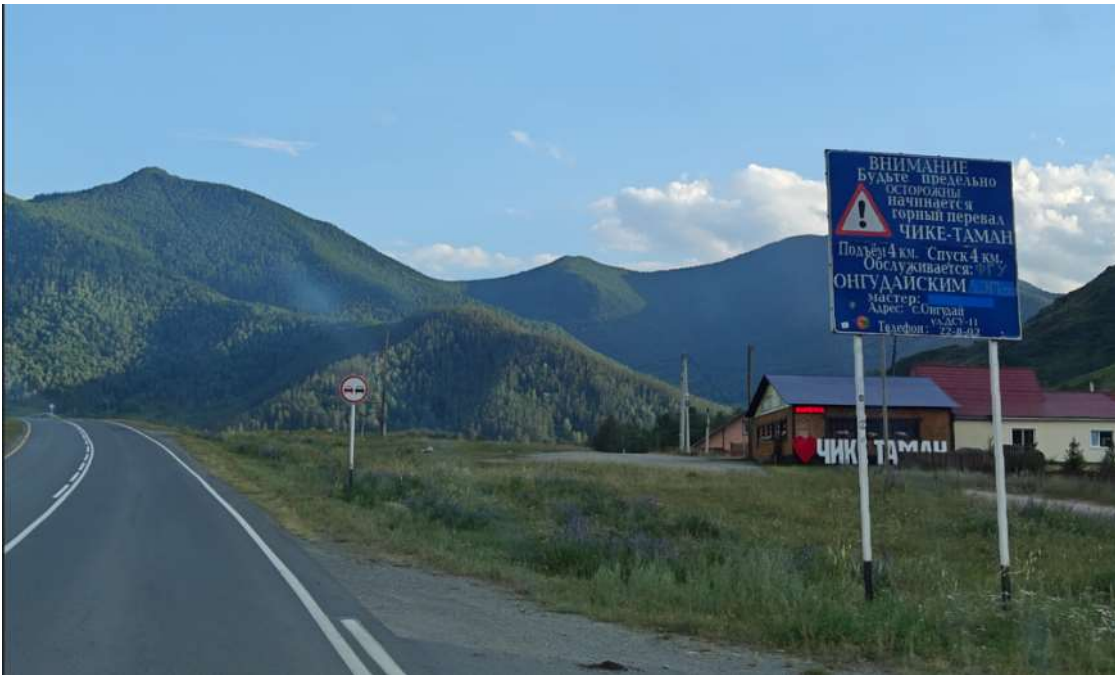
Информационный щит, предупреждающий о начале перевала.

Асфальтовая дорога, подъем и спуск с уклоном до 12°, крутые повороты.