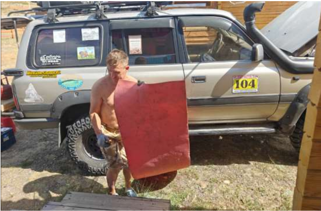
Укладываем вещи в машину и выезжаем.