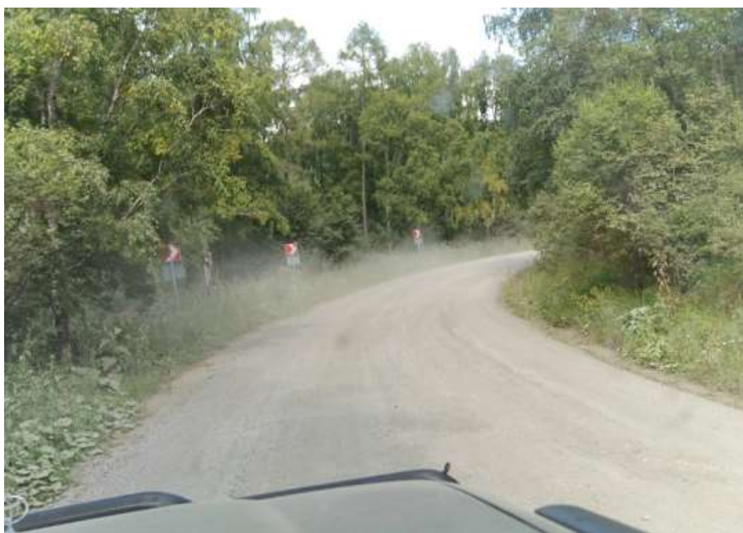
Гравийная дорога, крутые повороты.