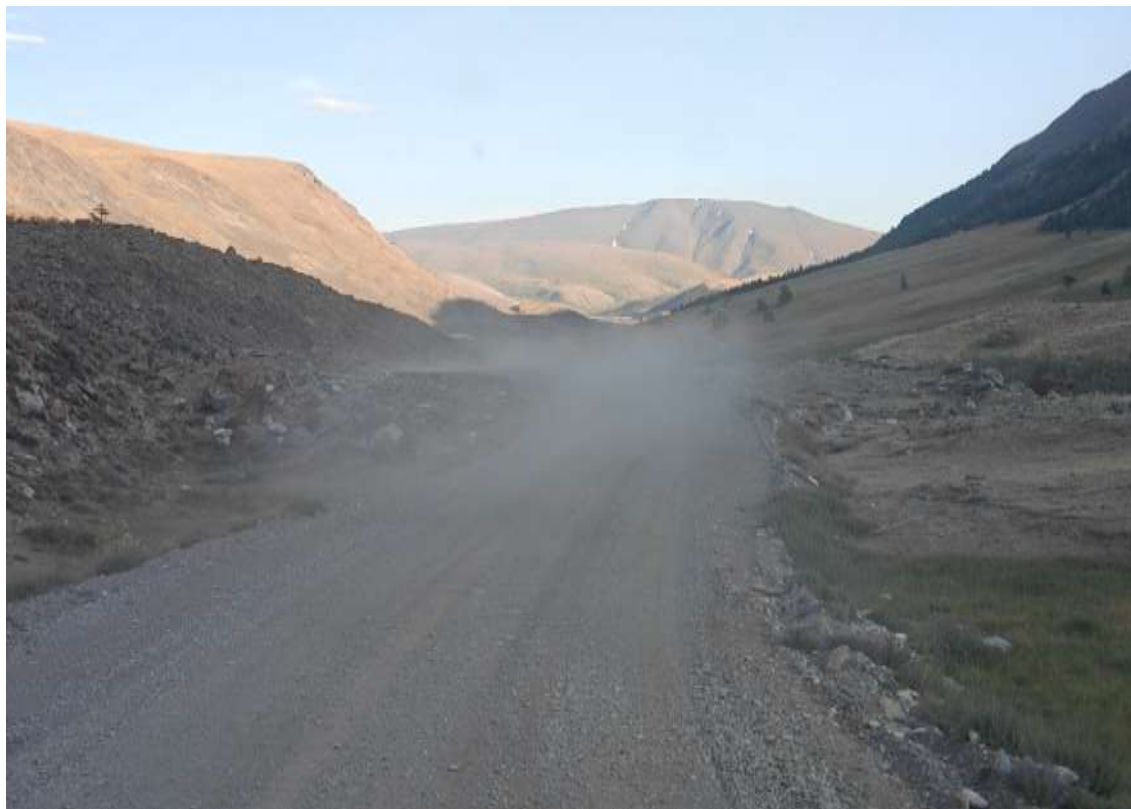
Дорога сухая, соответственно поднимается пыль от встречных и попутных автомобилей. Падает видимость. Нужно ехать очень внимательно.