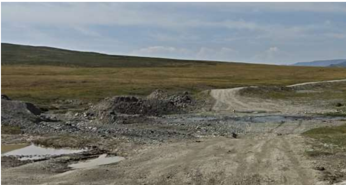
Разрушенный мост через ручей. Ручей мелкий, спокойно пересекаем его через накатанный объезд.