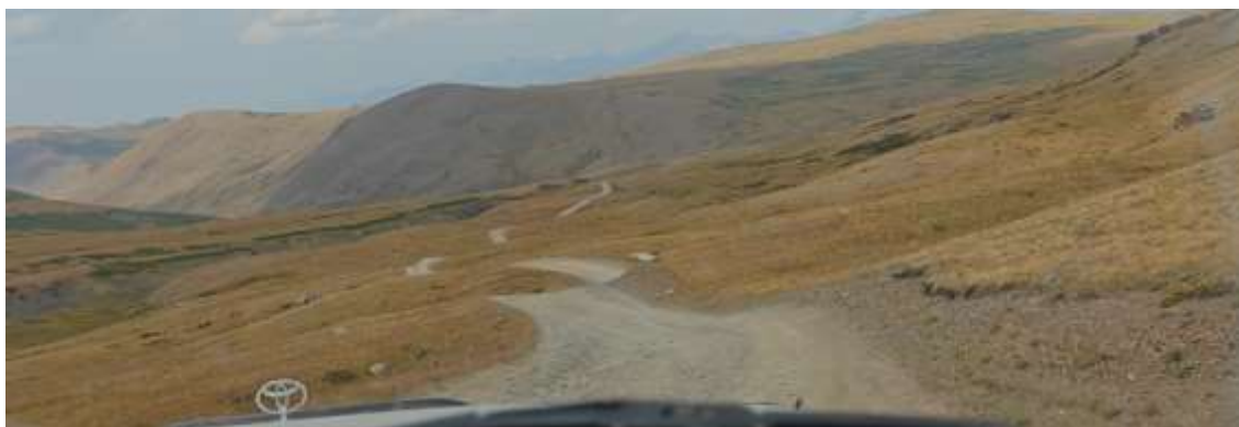
Спуск с перевала в долину р. Жумалы к Джумалинским источникам. Спуск плавный, уклон до 8%, без крутых поворотов.