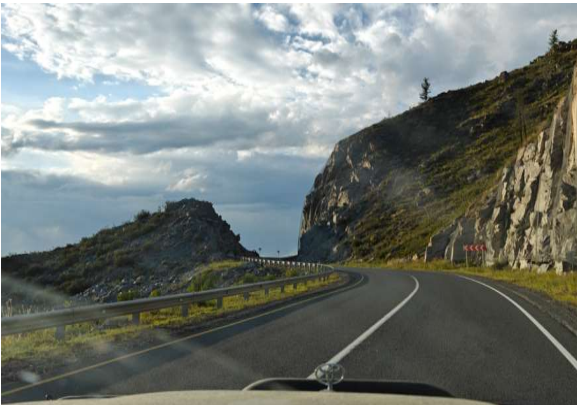
Очень много крутых поворотов. Едем, соблюдая скоростной режим и правила дорожного движения. Высота перевала – 1295 м, подъём, спуск – 4 км, с уклоном до 12%.