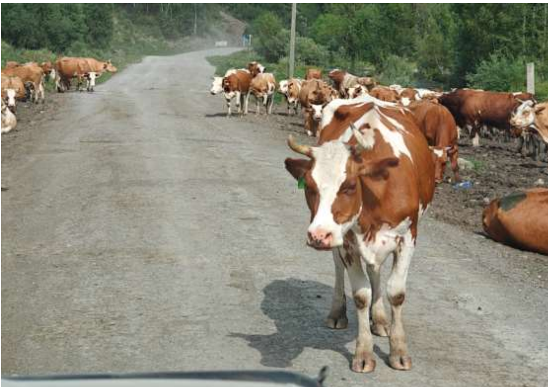
Эта коровка не сдвинулась ни на сантиметр, приходится ее аккуратно объезжать.