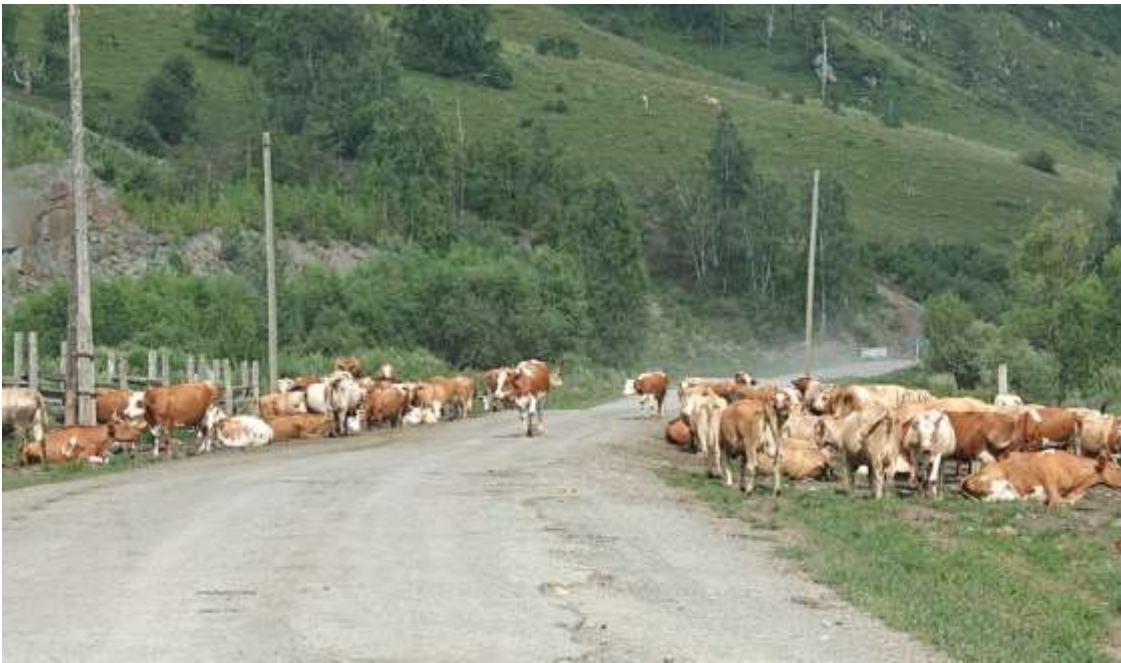
Отдельным видом препятствия на Алтае являются коровы, стоящие на дороге.