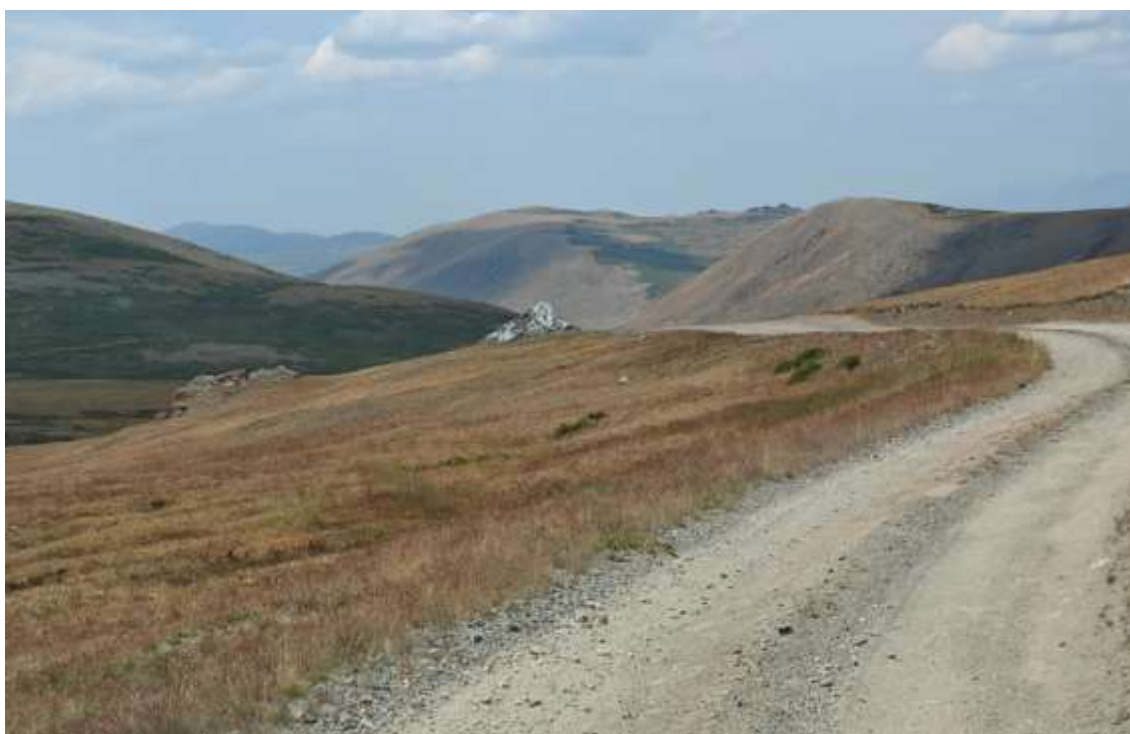
По мере приближения к вершине перевала дорога становится лучше, крупных камней практически нет.