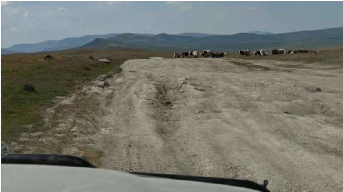
Ямы-неровности на дороге.