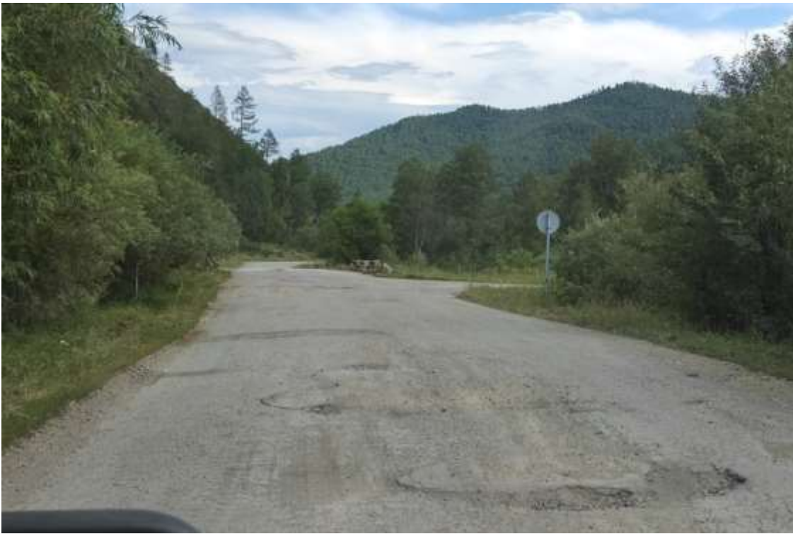
Разрушенный асфальт с ямами. Снижаем скорость, объезжаем ямы.