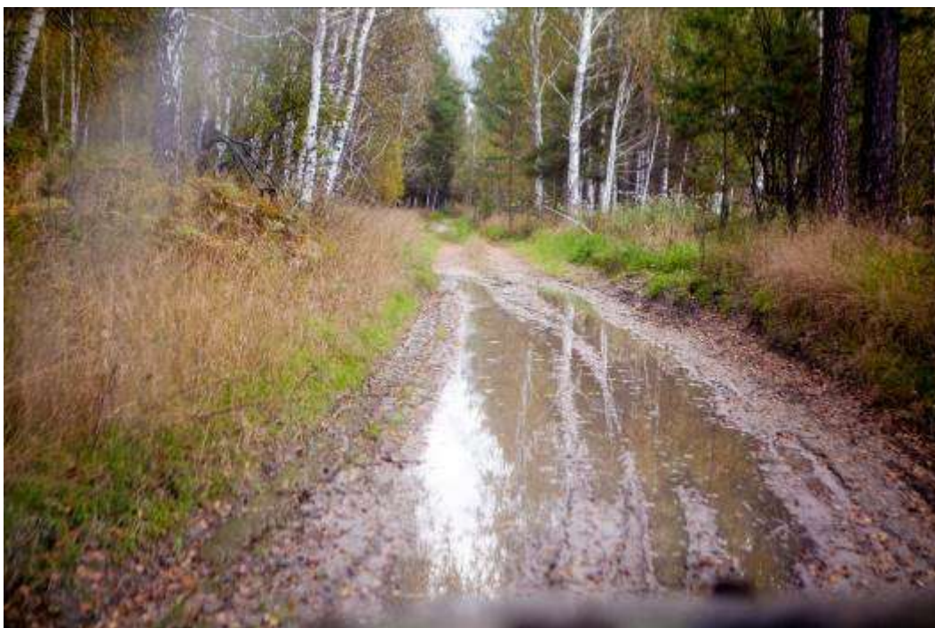
Грязевые участки с лужами на участке с. Нижнекаменка – с. Битки.