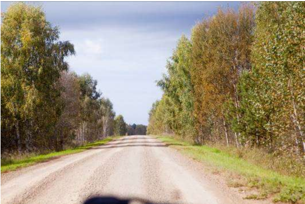
Участок гравийной дороги.