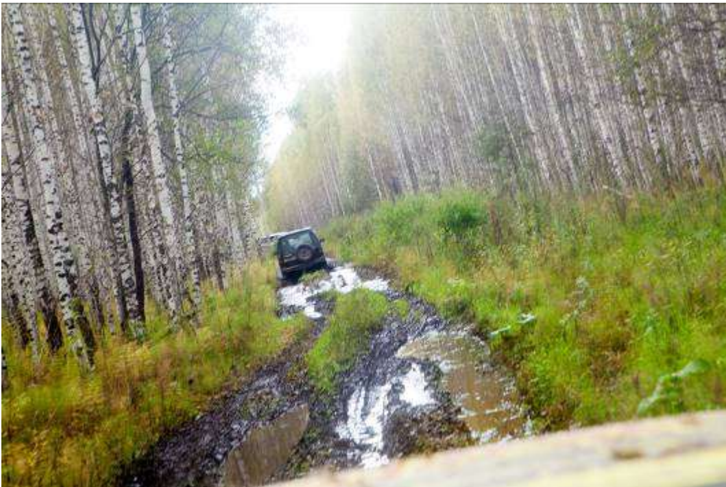
Дорога через березовую рощу, когда-то здесь были поля.