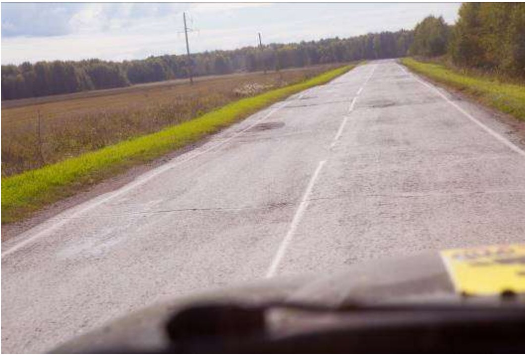
Неровности на дороге, необходимо соблюдать скоростной режим.