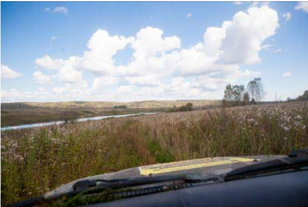
Раньше здесь стояла деревня, дорога еле угадывается и вскоре пропала совсем.