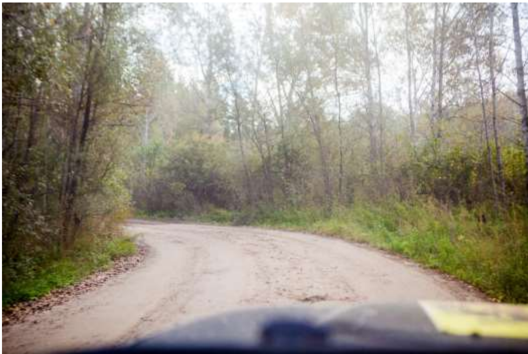
Участок центральной просеки недалеко от Нижнекаменки.

Завьялово – Битки. Участок песчаной дороги по просеке - 40 км. Извилистая лесная дорога с лужами, участками грязи, местами колея - 20 км