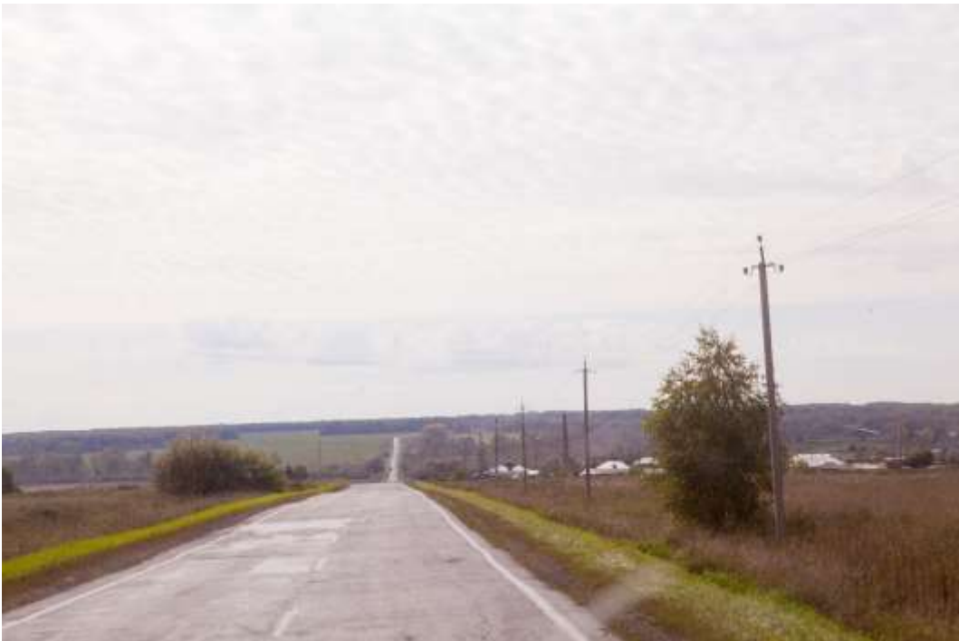
Спуски и подъёмы с небольшими уклонами.