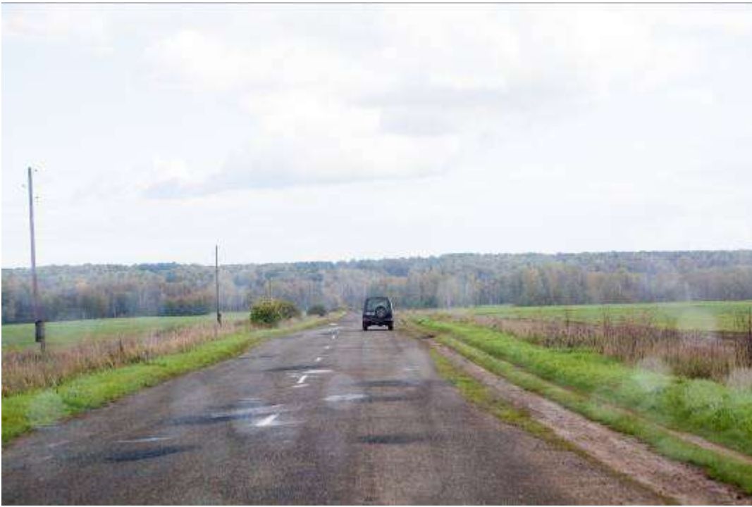
Старая асфальтовая дорога со следами ремонта.