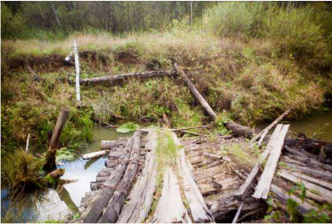
Разрушенный мост через реку Верхний Сузун.