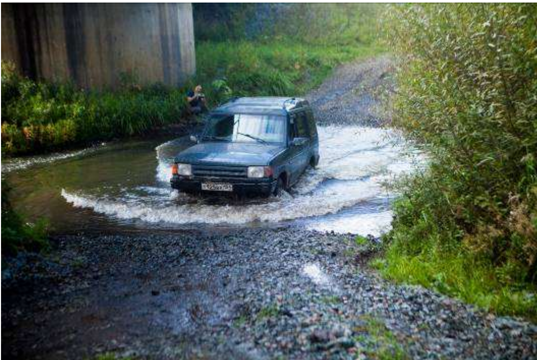
Прохождение брода через реку Верхний Сузун.