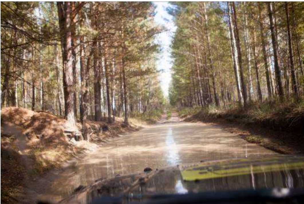
Большие лужи на дороге, дно песчаное.