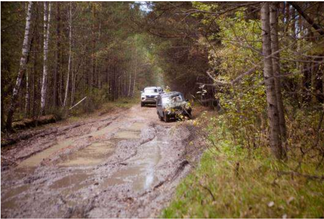
Грязевые участки дороги.